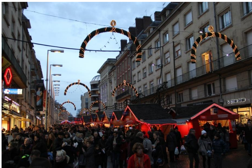
Marché de Noël Amiens 2013

(plus de détails seront donnés par voie d'affichage et distribution de tracts dans les boîtes aux lettres).