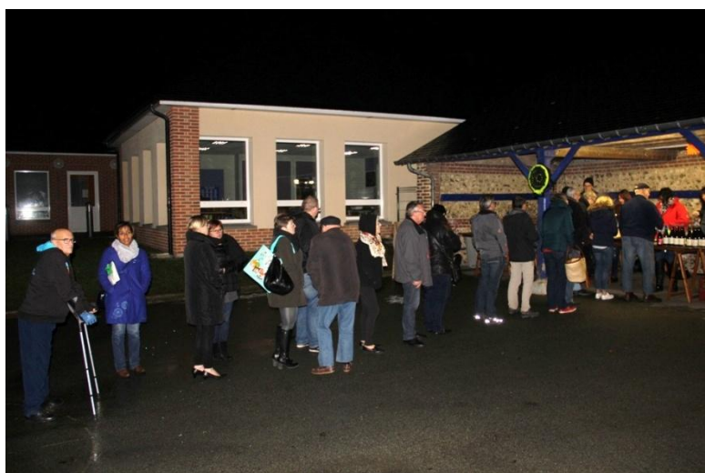
Téléth h n 2016

Toute l'équipe du Comité se fera une nouvelle fois un plaisir de vous accueillir dans une ambiance champêtre sur le parking de l'église pour une vente de harengs grillés avec sa traditionnelle pomme de terre en robe des champs à partir de 18 heures jusqu'à 21 heures. Venez nombreux les bénéfices seront reversés à l'AFM Téléth h n.