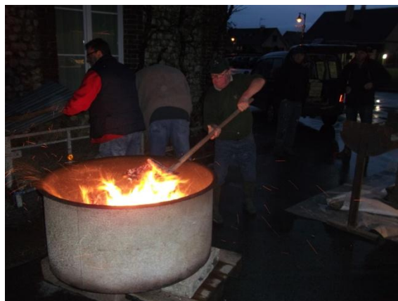
600 harengs furent grillés